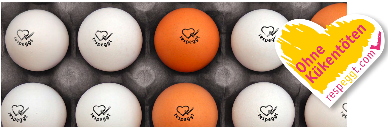
Abb. 2: Respeggt-Stempel und Respeggt-Herzsiegel